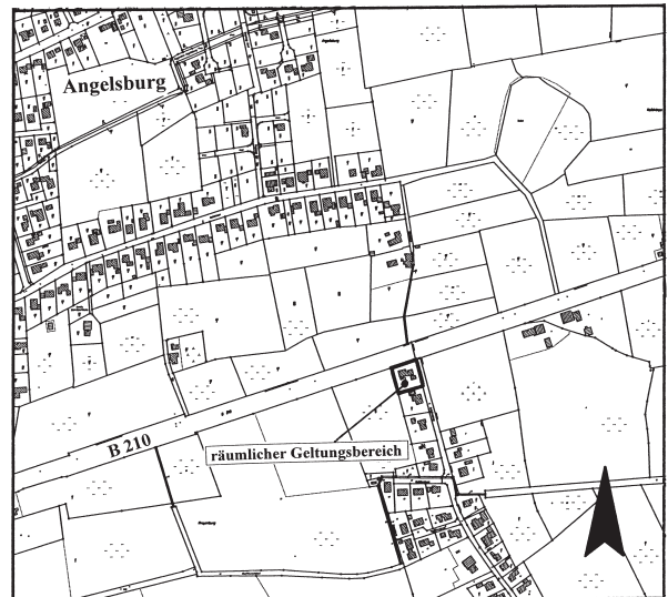
Kartengrundlage: Automatisierte Liegenschaftskarte (ALK) (verkleinert) vervielfältigt mit Erlaubnis des Herausgebers (Katasteramt Wittmund)

Der räumliche Geltungsbereich der Satzung ist aus der nachstehenden Übersicht ersichtlich.