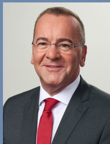
Boris Pistorius Niedersächsischer Minister für Inneres und Sport